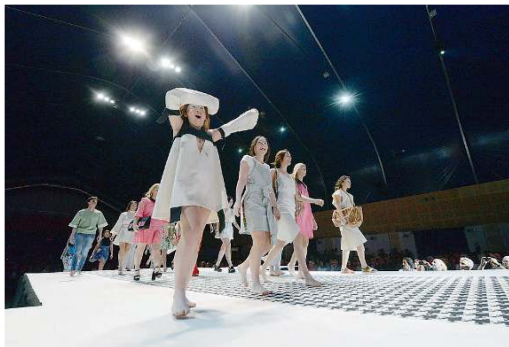
Fashion. La moda è solo uno degli ambiti di formazione in cui opera il Gruppo Foppa

Il lavoro è una prospettiva che attraversa gran parte dell'offerta formativa del Gruppo Foppa, accreditato da Regione Lombardia per offrire servizi ad hoc. Il grado di soddisfazione sfiora i dieci decimi, 140 sono gli inserimenti lavorativi realizzati, 470 i tiro-